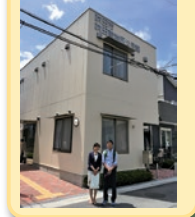
新吹田南地区公民館が完成(移転建て替え)