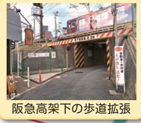
阪急高架下の歩道拡張