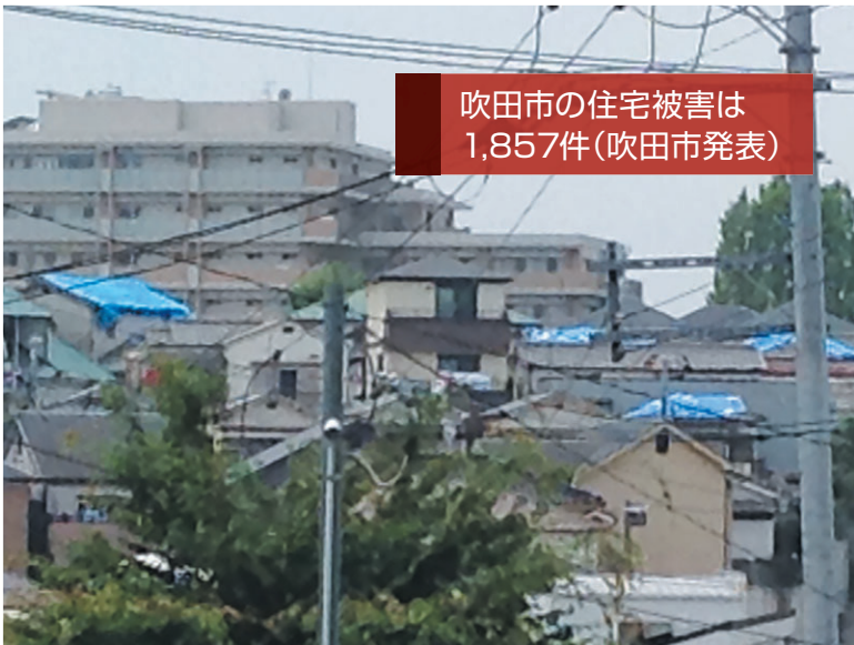
吹田市の住宅被害は 1,857件(吹田市発表)