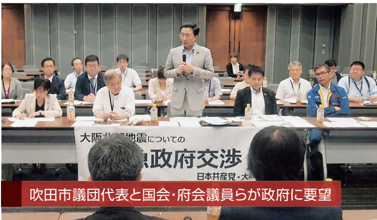
吹田市議団代表と国会・府会議員らが政府に要望