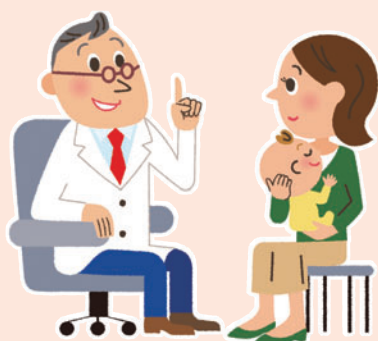
乳幼児医療費助成制度北摂7市実施状況(大阪府資料より) 平成27年1月現在

日本共産党はすべての子どもが親の所得に関係なく医療を受けられるように、医療費助成制度の充実を求めてきました。毎年の予算要望や質問で取り上げて要求しました。所得制限の撤廃を求める請願が市民から提出され、日本共産党が紹介議員になりました。請願が採択されたことにより就学前まで所得制限がなくなりました。ひきつづき、拡充へがんばります。