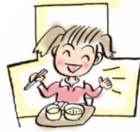
吹田5中 デリバリー方式の 中学校給食開始