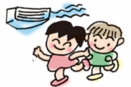
吹田保、東保、こぼと保、 どんぐり保 保育所のホームルームに エアコン設置