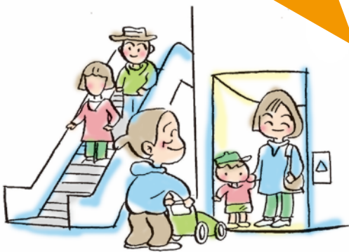
JR吹田駅前 エレベーター エスカレーター バリアフリー工事