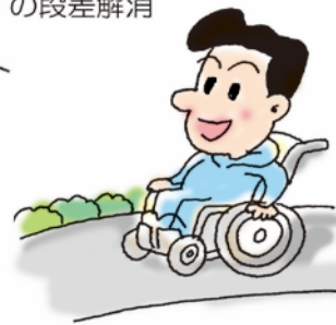
相川病院前 の段差解消