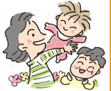
吹田保 保育園で一時預かり