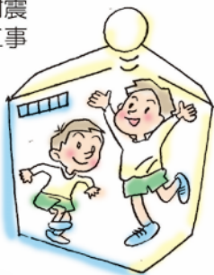
吹三小、東小 体育館 耐震補強工事