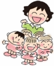
吹三幼稚園 園舎耐震 補強工事