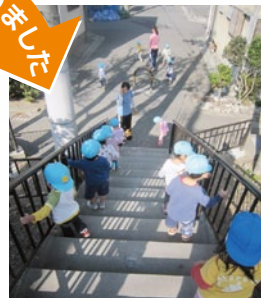
階段の手すりのとりかえ。 子どもたちも安心して 登降できます。