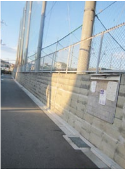
大高グラウンド沿い側溝工事。車が通りやすくなりました。

吹田市議会の日本共産党議員団は、本会議や委員会・審議会等の活動に加えて、地域の皆さんと力をあわせて、住みよいまちづくりに全力をあげています。2007年から2010年にかけてのまちづくりの状況(一部)をお知らせします。