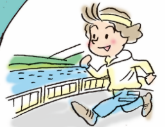
安威川堤防、 柵の改修