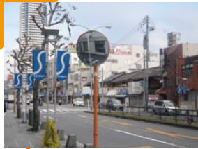
カーブミラー設置