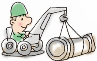
吹三地区 鉛管の 東地区 とりかえ工事