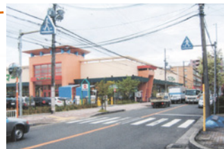
岸辺駅商業施設周辺の安全対策(横断歩道・信号機など)