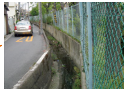
山二小学校横 側溝にふたをして安全な歩道の確保を要望 整備のための調査を予定