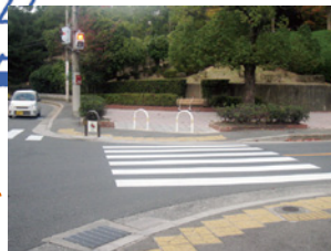
新芦屋中央公園 交差点歩道の拡幅