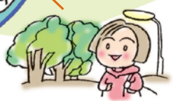
安全なスロープ 設置予定