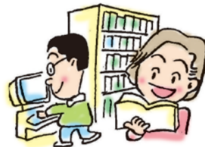
市民センター横 千里丘図書館建設(2012年オープン)