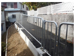
千里丘中遊園 近くのカタカタ道を改善

毎日放送跡地開発ははじめ大規模な開発から、自然と住環境を守るためにみなさんと力を合わせます