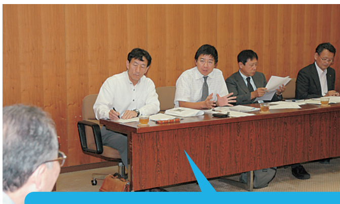
「後期高齢者医療制度反対」など医療崩壊を食い止める共同の取り組みが進みました。9月には医師会、薬剤師会、歯科医師会の主催で、社会保障費2200億円連続削減に反対する「緊急集会」が開催され、共産党議員団も参加しました。(写真は医師会との懇談)