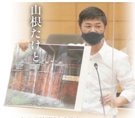
建設環境常任委員会 議会運営委員会