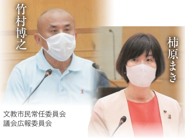
文教市民常任委員会 議会広報委員会