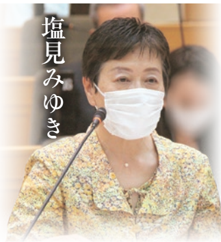
財政総務常任委員会 都市計画審議会

答弁(市長) 具体的な内容はまだ明らかになっていない。より良い計画になるよう意見を参考にします。