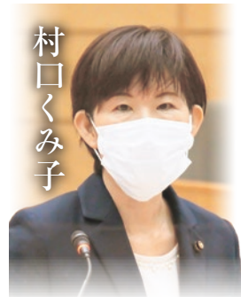
財政総務常任委員会 都市計画審議会

答弁(教育監) 教職員による日常的な観察、生活アンケート、面談等を行い、保護者と連携して把握に努めている。スターター、スクールカウンセラー、スクールソーシャルワーカー等専門家の配置で、見守りを強化している。