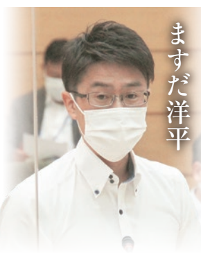
建設環境常任委員会 環境審議会