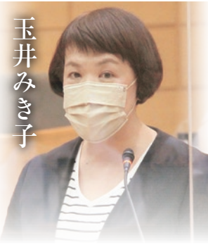
健康福祉常任委員会 議会運営委員会