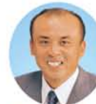
竹村 博之 議員