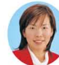
柿原 真生 議員