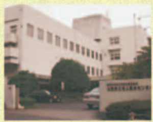
府立老人総合センター