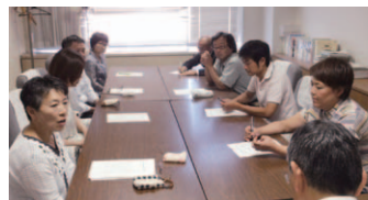
常時掲揚中止を申し入れ